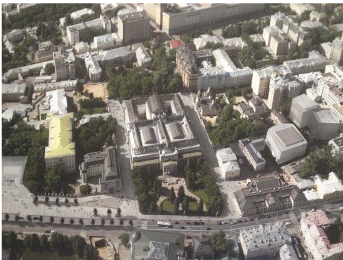
Общий вид Музейного городка