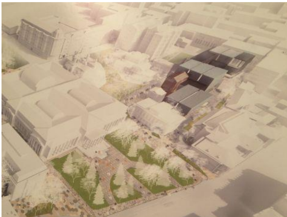
Проект Владимира Плоткина

очень хорошо. По-моему, музей такого уровня достоин площади. А так получается градостроительный винегрет: бесконечные новоделы и слабоотреставрированные вещи. Цена одного дома ничто в сравнении с полученным результатом.