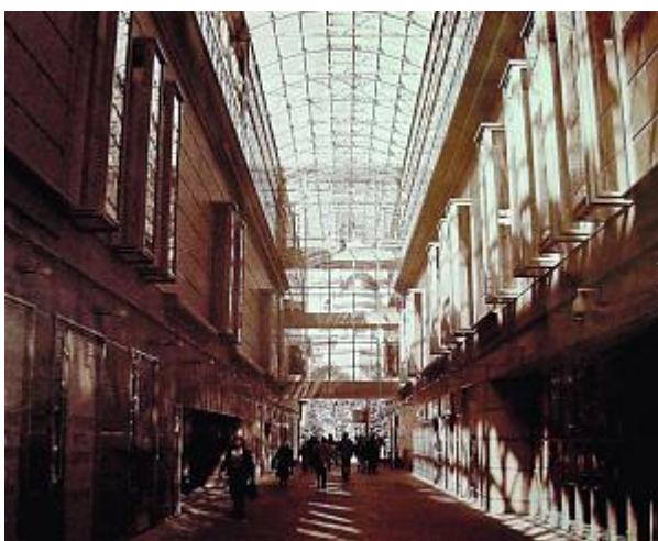
Комплекс зданий Государственного детского театра эстрады

- приблизительно треть представленных работ может быть охарактеризована как направленные на радикальную трансформацию сложившейся среды;