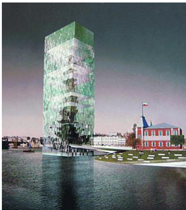
Музей Церетели Бюро Бернаскони

Проект бизнес-центра на Рублевском шоссе.