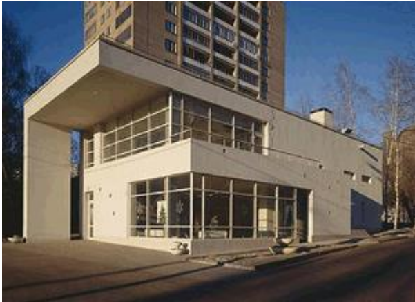
I Здание «Рафинад», ул. Стромынка, 19 АМЛ, Н. Лызлов

Это здание уникально своим размером, которого почти не встретишь в современной Москве, охваченной масштабным строительством. И хотя оно повторяет формулы многих известных зарубежных построек II-III четвертей прошлого века, это красивый штрих в портрете современной столицы, подкупающий своей изящностью иероглифа.