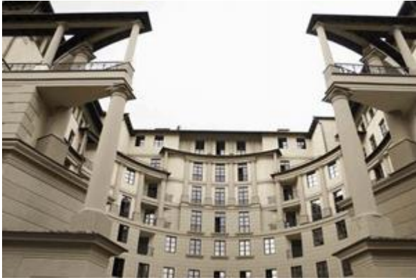
IV Жилой дом во 2-м Казачьем пер., 2-й Казачий пер., 4-6 М. Филиппов

С точки зрения образности, это очень выразительный дом. Единственный достойный образец в Москве средиземноморской архитектуры.