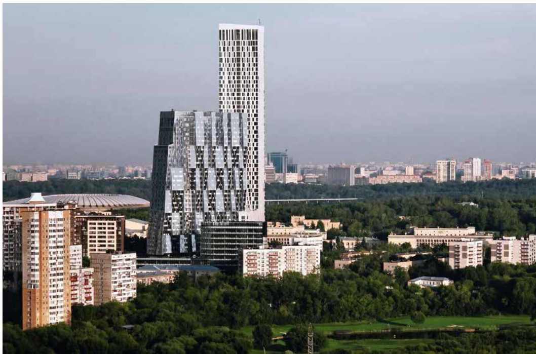
Жилой комплекс «Дом на Мосфильмовской», Москва, ул. Мосфильмовская. Архитекторы: Сергей Скуратов, Иван Ильин и др., 2012 г.

Э. У.: Говорят, лучшим годом в истории кино был 1999-й. А в истории архитектуры какой период, по-вашему?